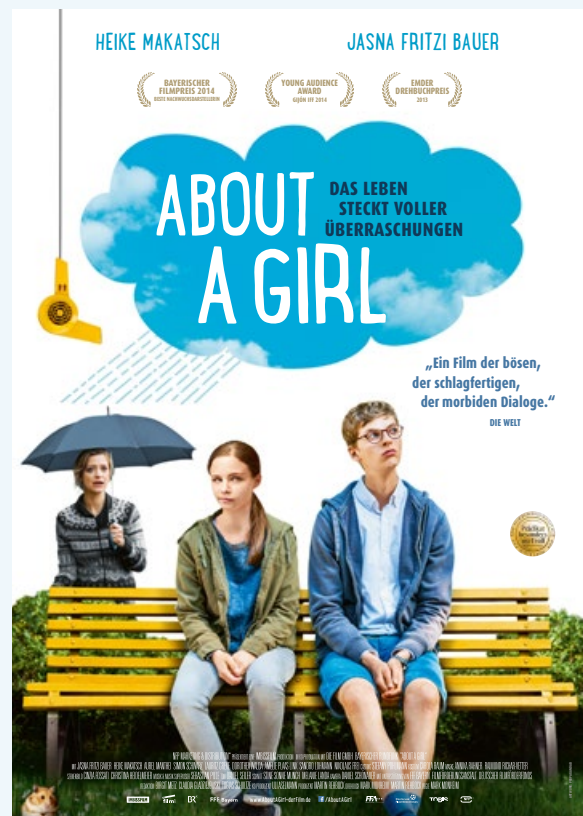
(Plakat zum Film)